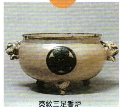
葵紋三足香炉 水戸光圀から授与の品